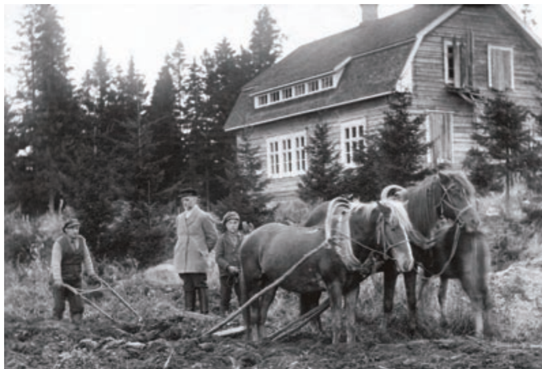
Santeri Alkio (1862 – 1930) ja pellonmuokkaajat kotitilalla Laihialla.