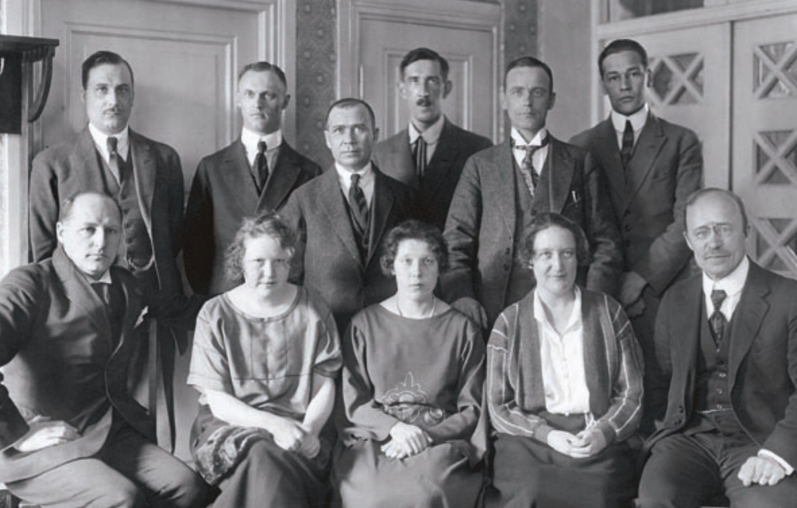
MTK:n toimihenkilöt vuonna 1923.

siin ja vain osa heistä kuuluu osuuskassoihin ja osuuskappoihin, puhumattakaan muista yhteenliittymistä. Ja vielä pahempi on se seikka, että monet maanviljelijät ovat viime aikoihin saakka pysyneet yhteenliittymisaatteen vastustajina, ainakin salaisina, jolle juuri julkisina.