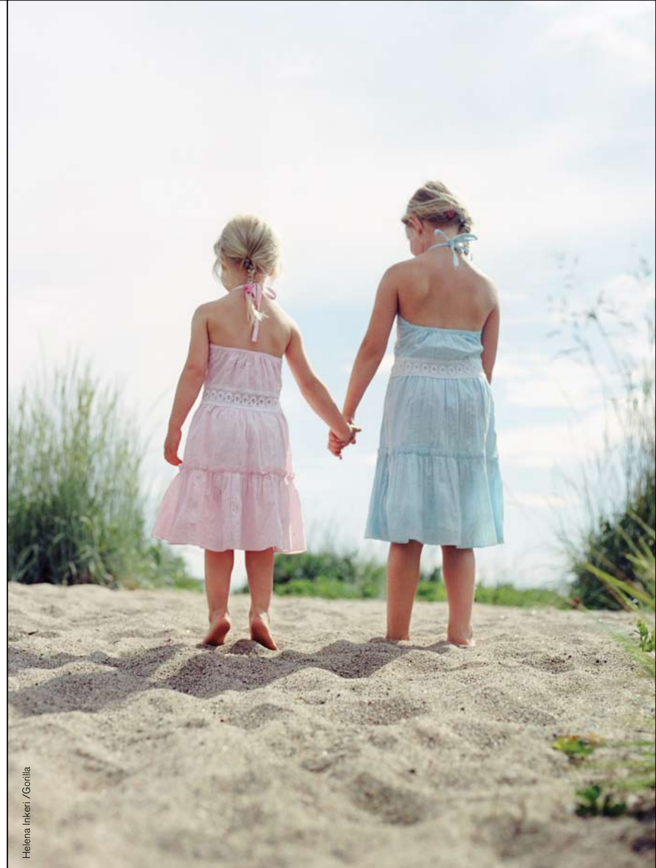
Helena Inkeri / Gorilla