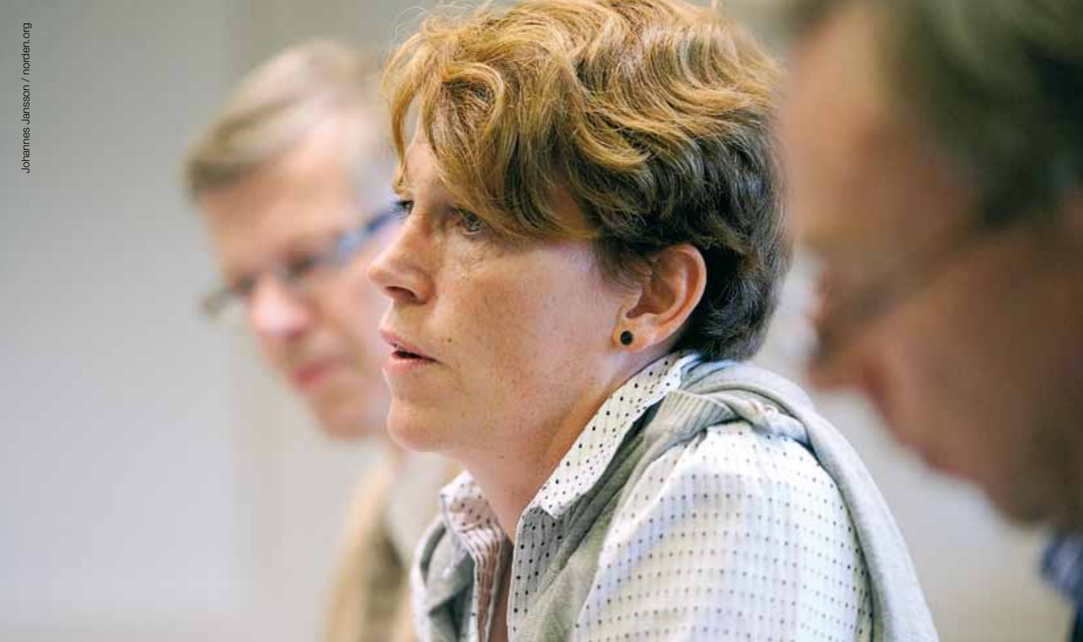
Keskiryhmän Christina Gestrin toimi Itämeren parlamentaarikkojen puheenjohtajana vuonna 2010.