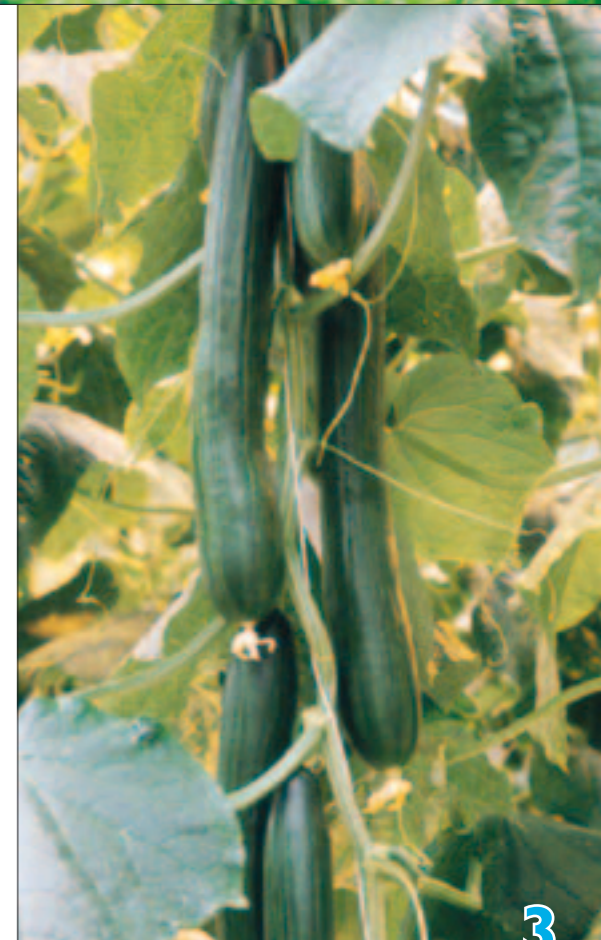
Kurkku tuottaa keskimäärin 40-50 hedelmää kasvukauden aikana.

”Propaani palaa puhtaasti, siinä ei ole mitään epäpuhtauksia. Kasvihuoneet pysyvät siisteinä ja kasvit voivat hyvin. Olemme tyytyväisiä kaasuyhteistyöhön. Kaikki asiat on hoidettu poikkeuksellisen hyvin. Laitteet ovat tosi hyvässä kunnossa”, Rapila kiittää.