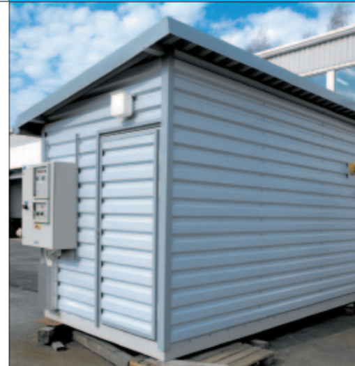
Teräsprofiililevystä valmistettu kontti voidaan sovittaa muiden rakennusten väleihin.