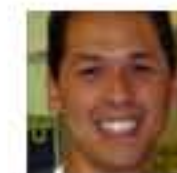
Mickeymouse Kommentaattori Yhteiskunnalliset vaikuttajat ry