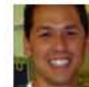
Mickeymouse Kommentaattori Yhteiskunnalliset vaikuttajat ry