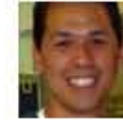
Mickeymouse Kommentaattori Yhteiskunnalliset vaikuttajat ry