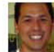
Mickeymouse Kommentaattori Yhteiskunnalliset vaikuttajat ry