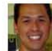
Mickeymouse Kommentaattori Yhteiskunnalliset vaikuttajat ry