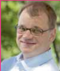
Juha Sipilä, s. 1961